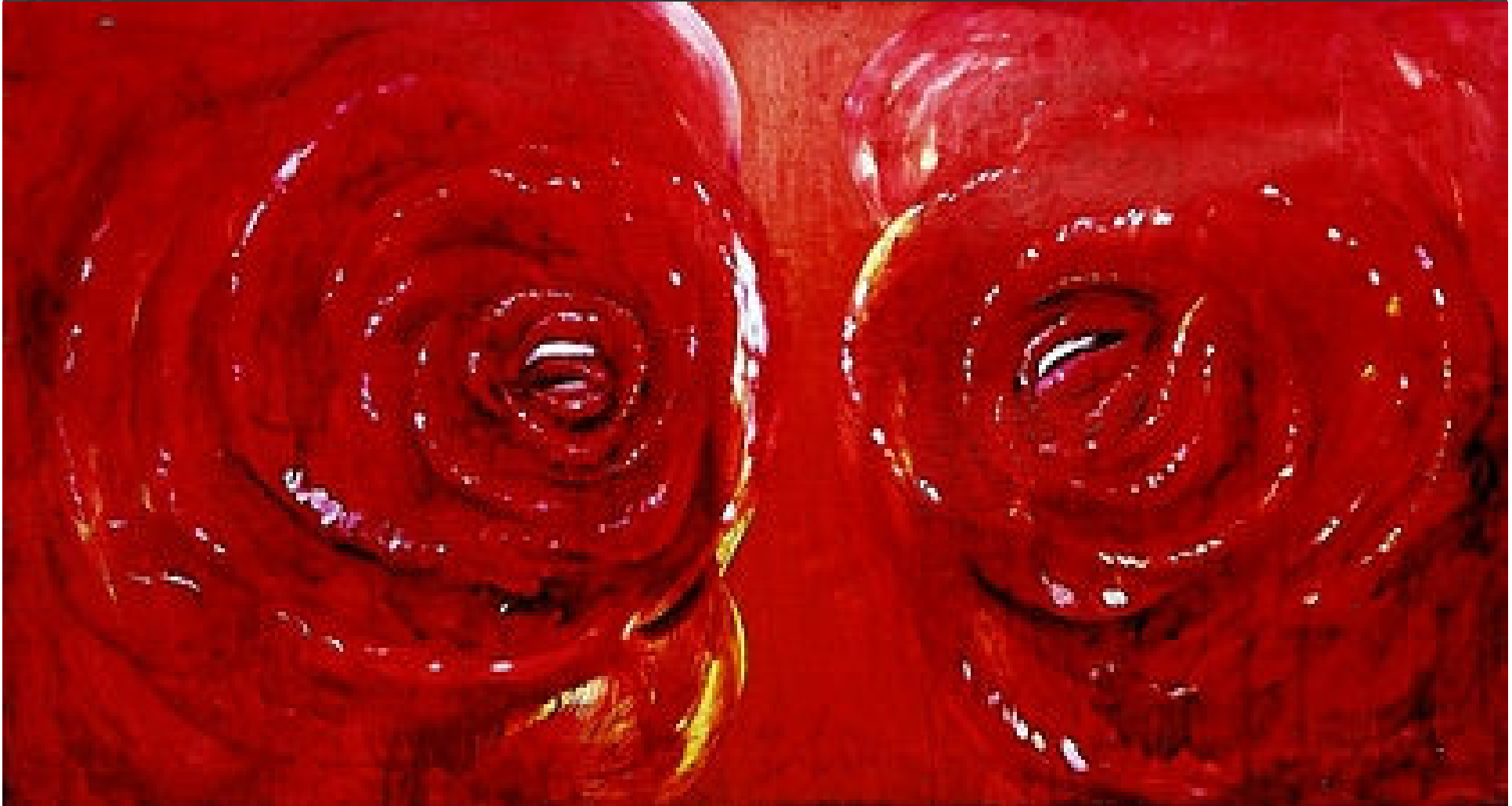
Conversatie - Elian ( pictura pe panza - courtesy of the artist )