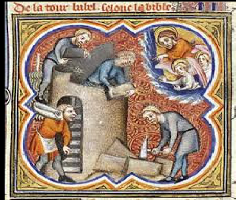
Constructia catedralei din D

« Mestesugarul desavarsit » sub comanda (publica sau privata)