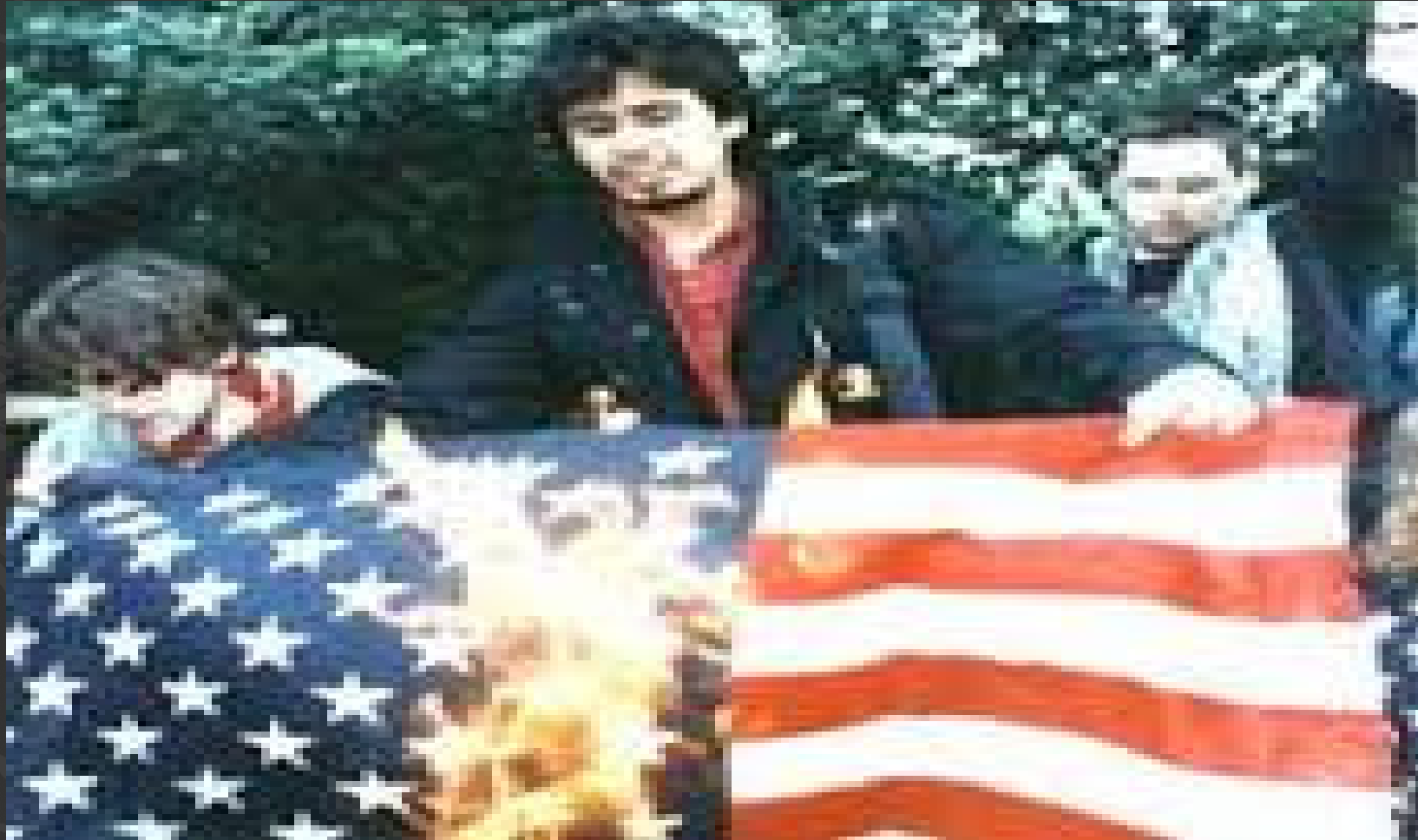
Texas v. Johnson (Supreme Court US)