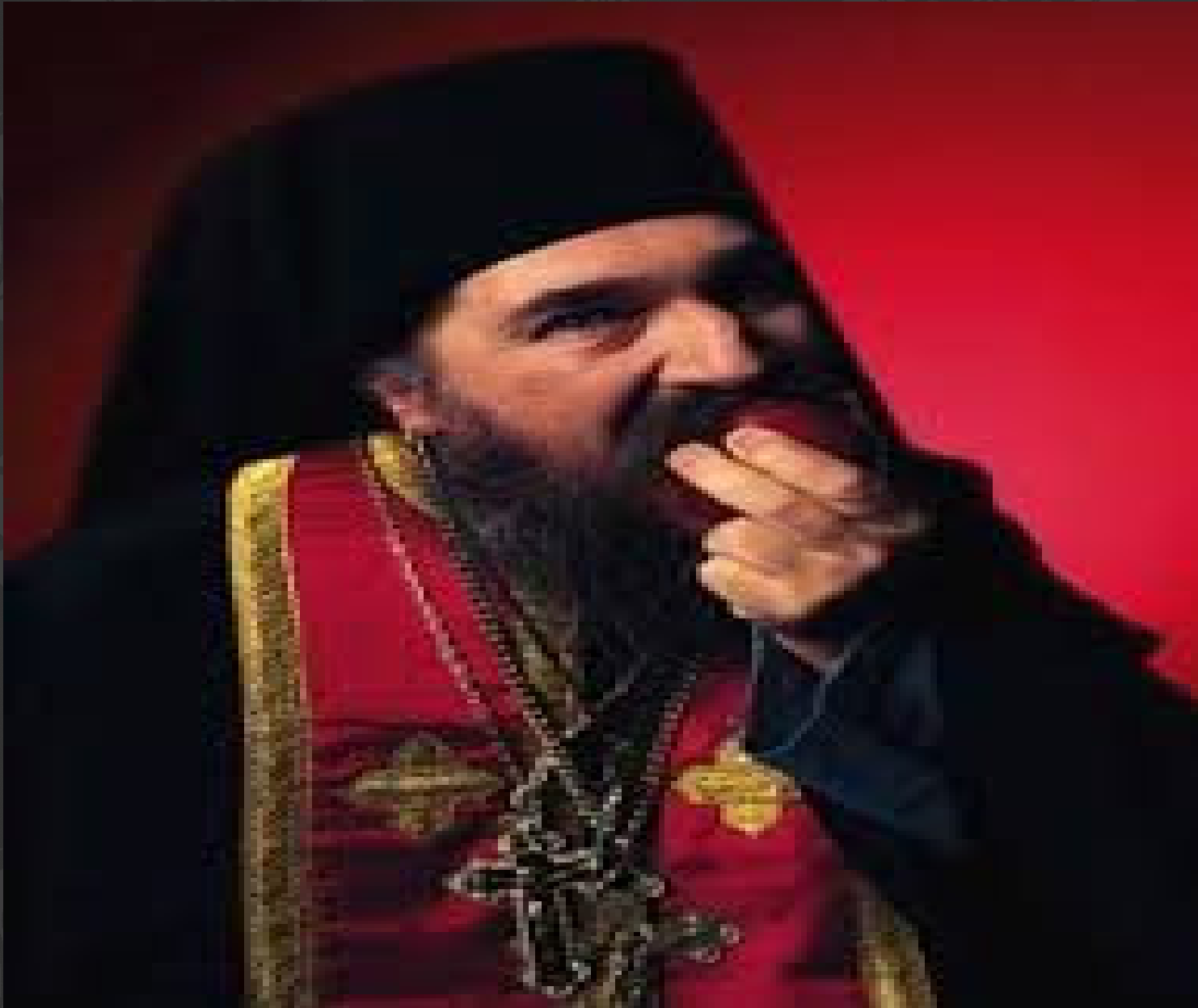
Otto Preminger Institute v. Austria (CFDA)