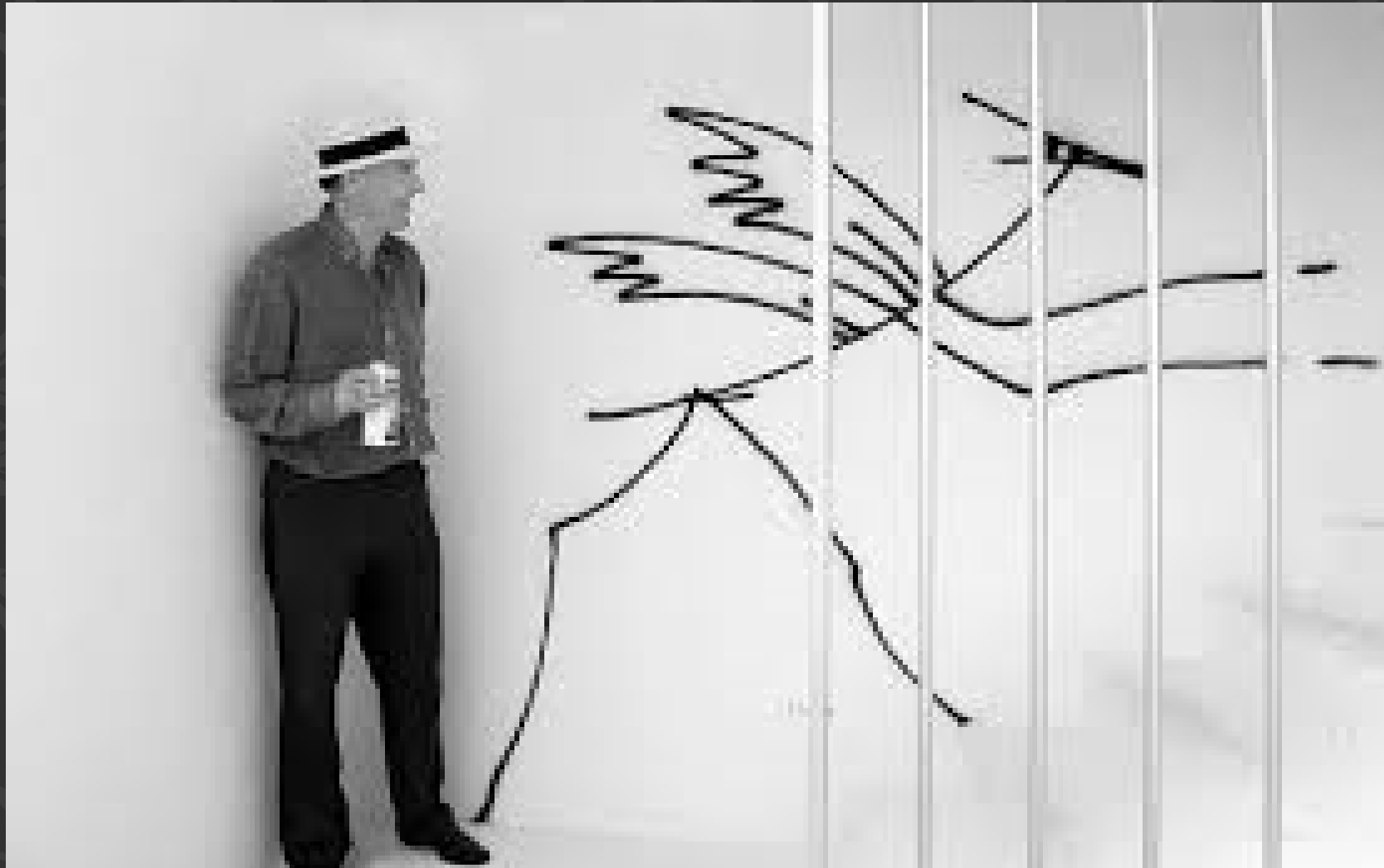
« the sprayer of Zurich » (Harald Naegeli)